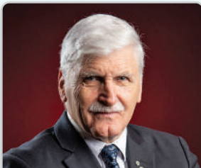
> Roméo Dallaire Lieutenant-général retraité et ancien sénateur