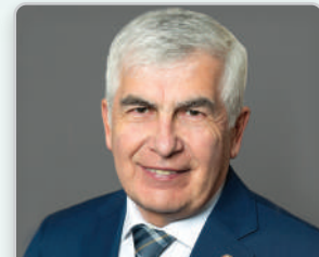
> Clément Gignac Sénateur et économiste